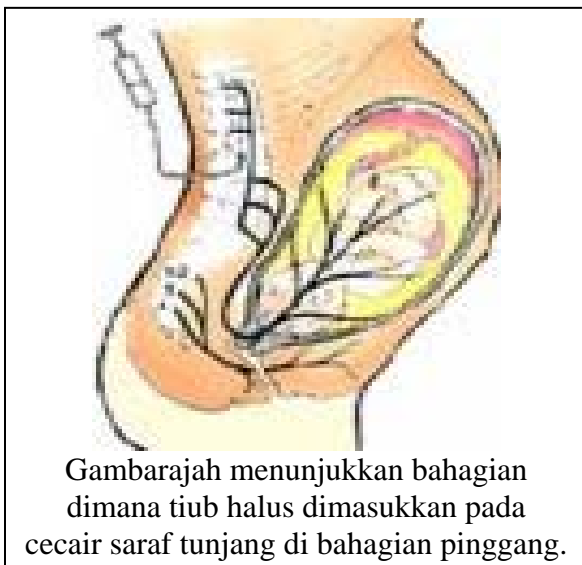
Gambarajah menunjukkan bahagian dimana tiub halus dimasukkan pada cecair saraf tunjang di bahagian pinggang.